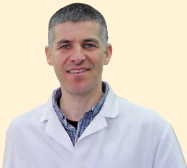
Martin Kremmeter Laboratorio: Sistemas UV